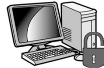
アプリケーション