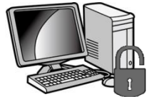
パラメーター操作